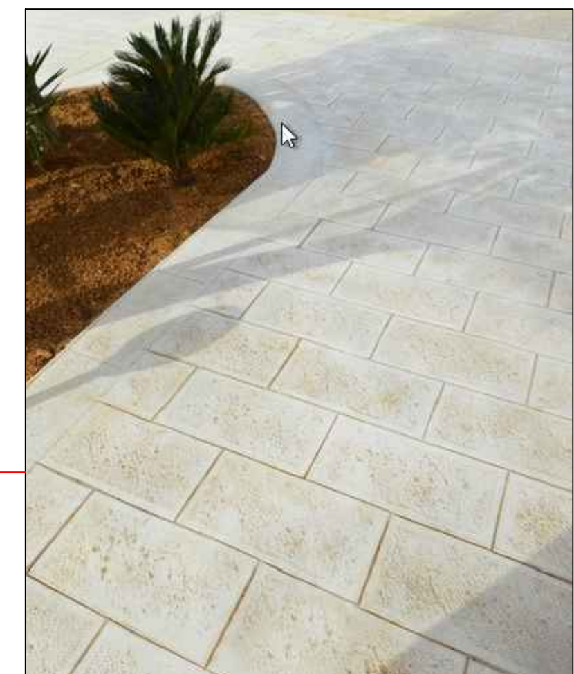
Pavimento in calcestruzzo stampato