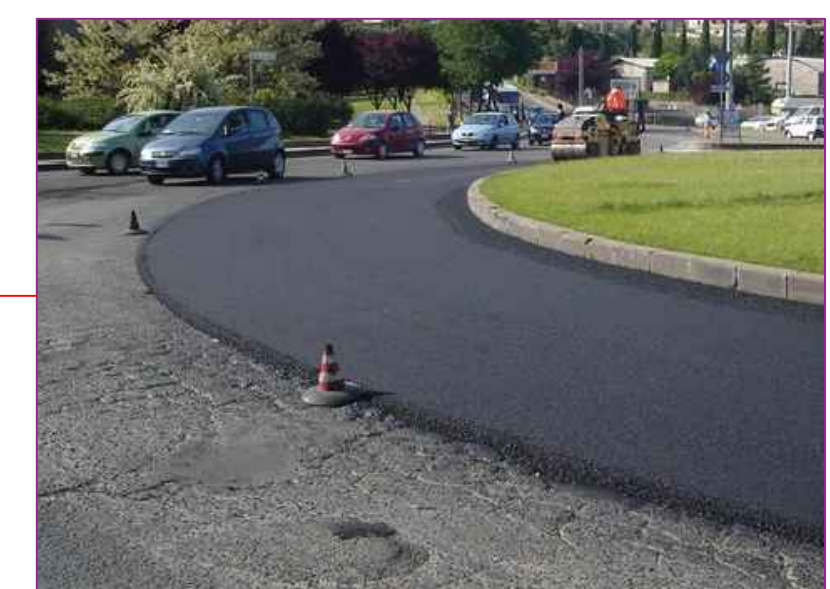
Asfalto in conglomerato bituminoso